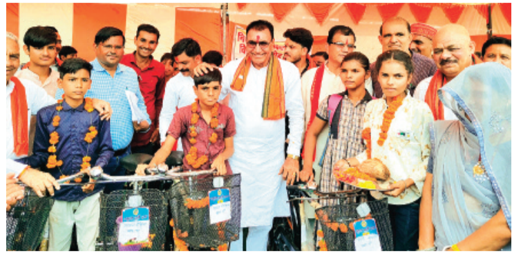
हरिभूमि न्यूज ▶▶ ब्यावरा